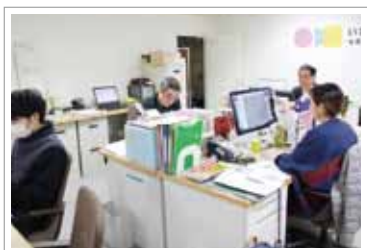
3名の専任コンシェルジュが常駐しています

いきがい活動ステーション 〒802-0006 北九州市小倉北区魚町三丁目3-20 中屋ビル地下1階 運営時間 9時30分～20時 休館日 月曜日、祝日、年末年始 TEL 093-967-3420